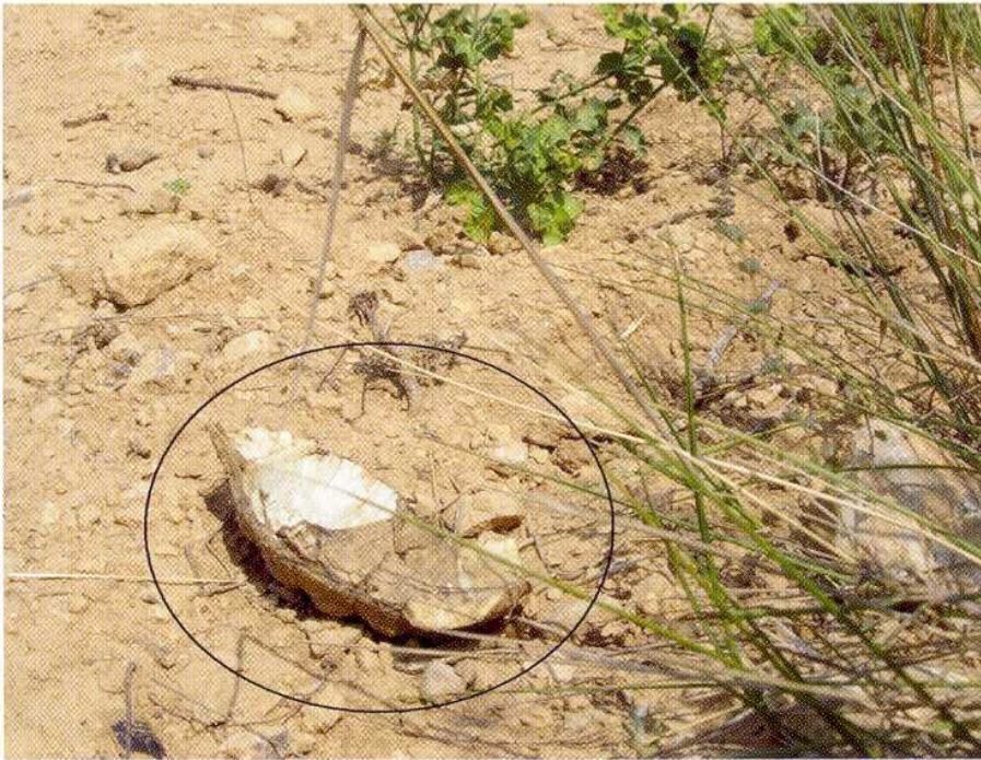
Fig. 3 : Tortue écrasée par un tracteur dans une vigne.

(592) des photos, diverses espèces ont été photographiées : la genette ( Genetta genetta ) dans 81% des cas, suivie de la fouine ( Martes foina ) 16 %, du renard ( Vulpes vulpes ) 2 %, et du blaireau ( Meles meles ) 1 %. Bien que la prédation soit un paramètre inhérent aux relations écologiques, la présence de la faune domestique sauvage ajoute une pression à celle déjà exercée par les espèces sauvages. Pour la conservation des tortues, la situation idéale serait un équilibre avec leurs prédateurs, mais il faudrait procéder à l'élimination totale des chiens sauvages.