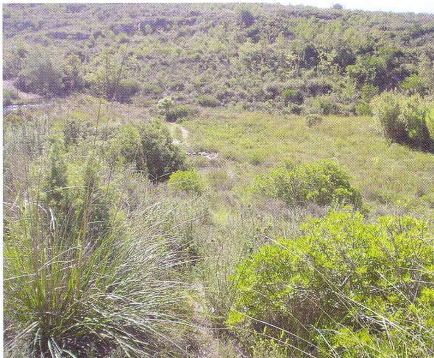
Fig. 1: Habitat typique de la Tortue d'Hermann au Parc du Garraf.

The Mediterranean tortoise ( Eurotestudo hermanni ) (Gmelin, 1789) has been present in the Garraf Natural Park since 1992 as part of a reintroduction project of the species coordinated by the Catalanian Department of Environmental Affairs