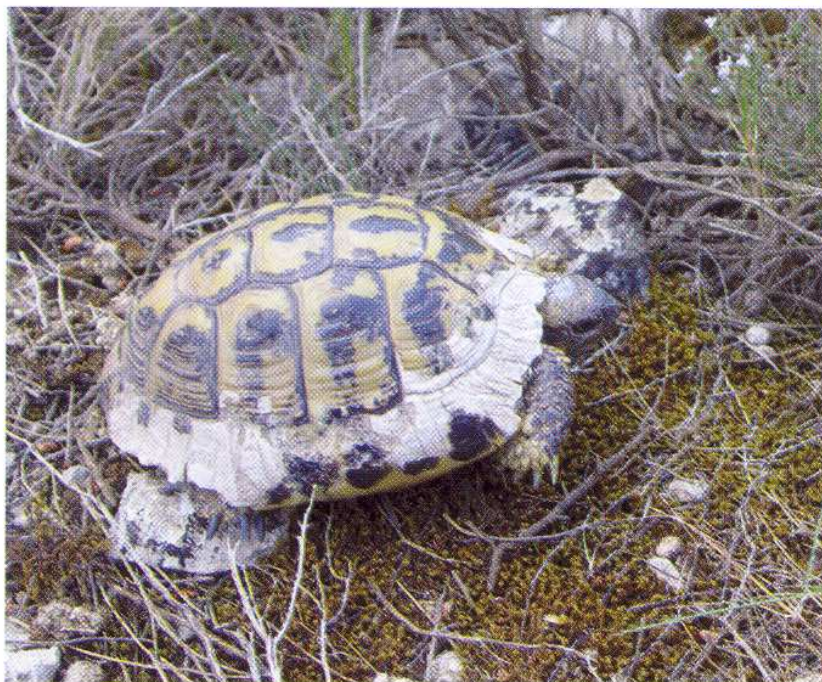
Fig. 4 : Signaux de tentative de prédation sur un mâle adulte.

SOLER, J., MARTÍNEZ SILVESTRE, A., TARÍN, R., & PARELLADA, X., 2002- Evolució de la població reintroduïda de tortuga mediterrània ( Testudo hermanni