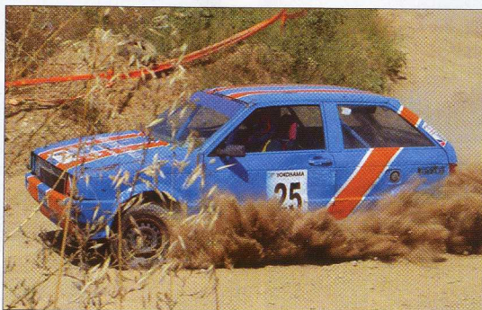
David Canals se impuso en la categoría 1 con su Seat Ibiza.