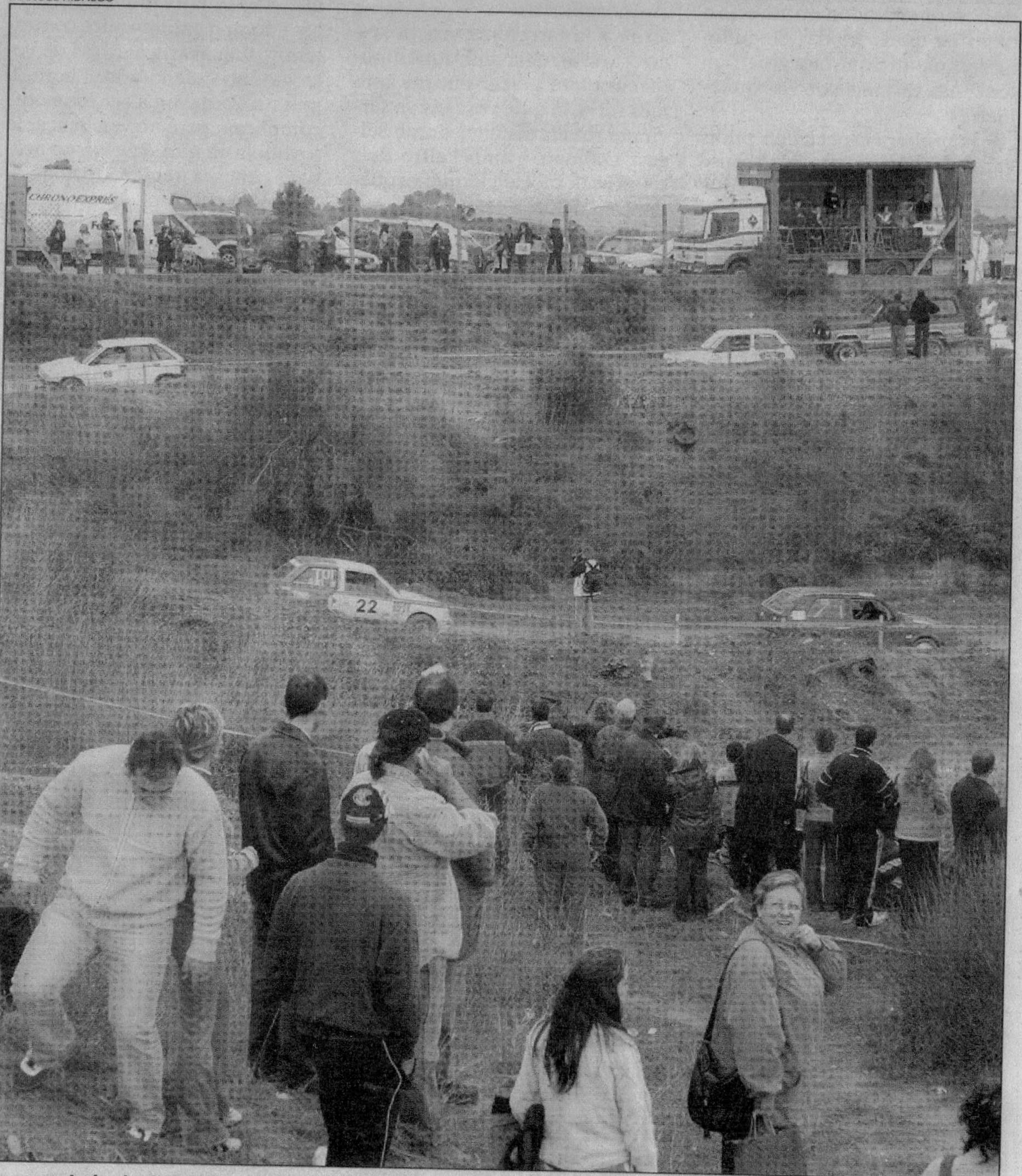
Bona assistència d'aficionats. El públic ha anat augmentant durant l'any