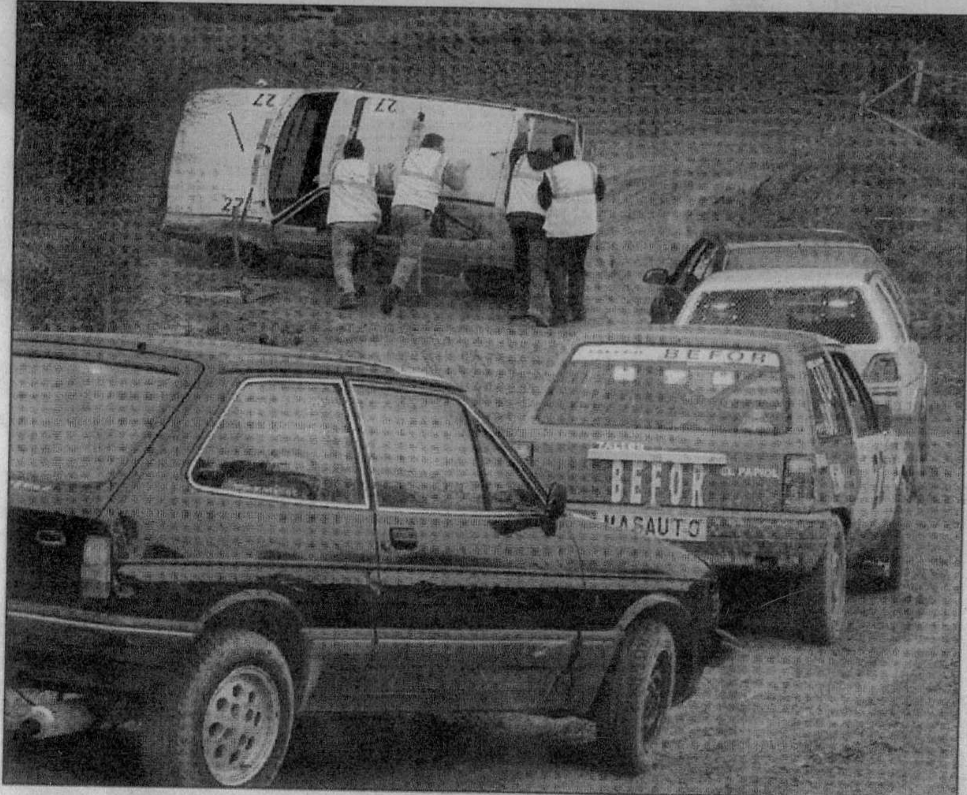
Un moment de la competició d'autocròs. Va ser espectacular