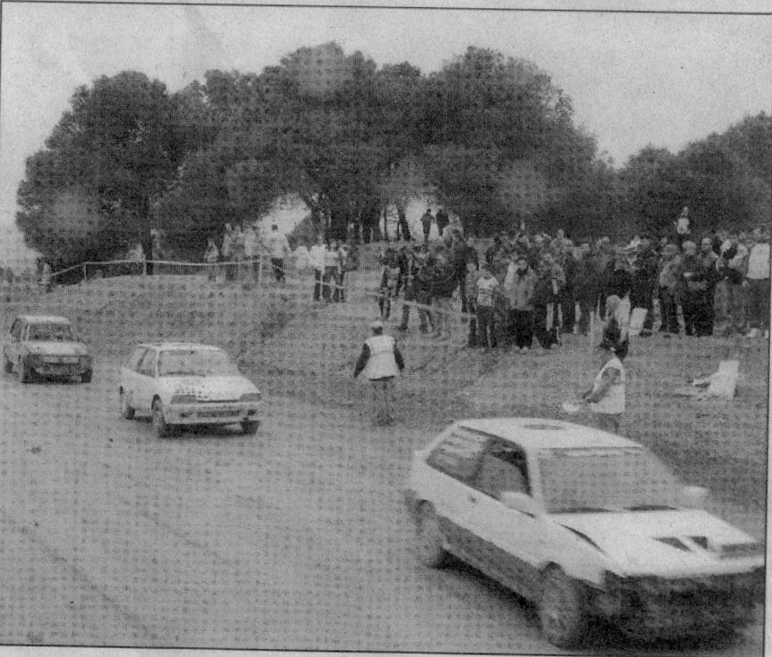
L'autocròs es consolida a Masquefa. Cada cop hi ha més participants