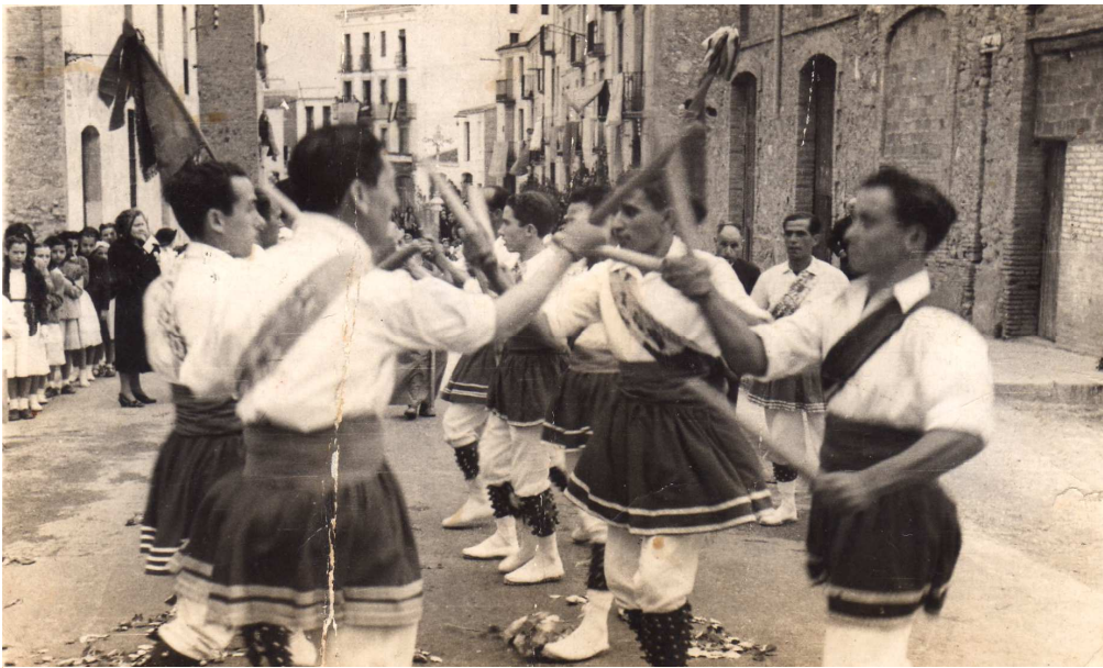
117. Masquefa, 1945. Festivitat de Corpus. La Colla dels Bastoners ballant al carrer Sant Pere.