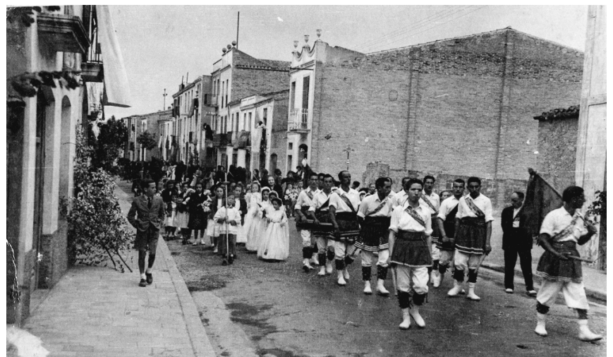
115. Masquefa. 1945. Festivitat de Corpus. La Colla de Bastoner en el dia del seu debut.