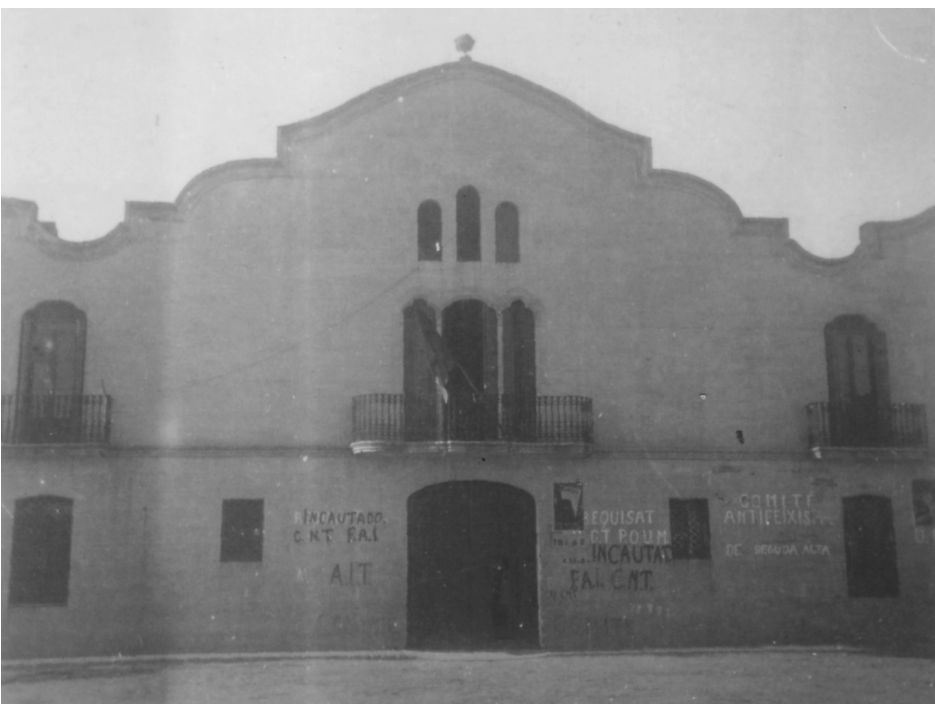
113. Can Simón (Beguda Alta), juliol del 1936.