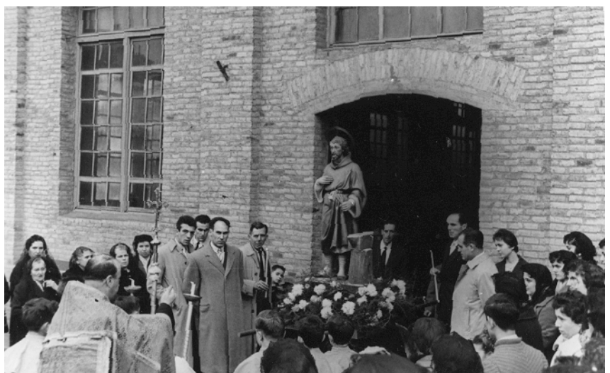
118. La festa de Sant Eloy. Benedicció de la imatge. Hom va instituir la festa el 1947.