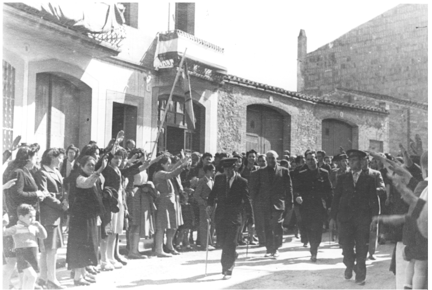
114. Masquefa, 1944. Visita del Governador Civil.