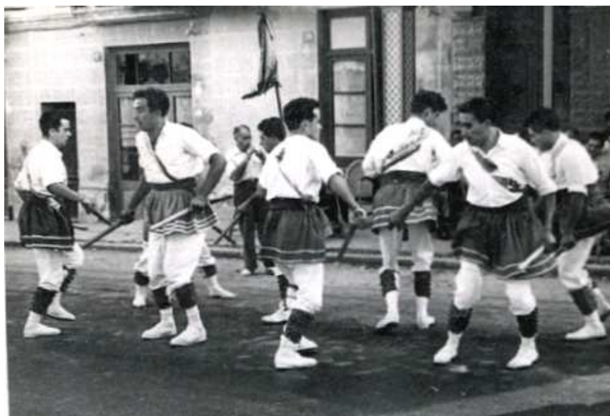
123. Capellades, 1949. Festa Major. Executant el Ball Nou.

Aquest establiment era a peu de la parada de la Genoveva , nom pel