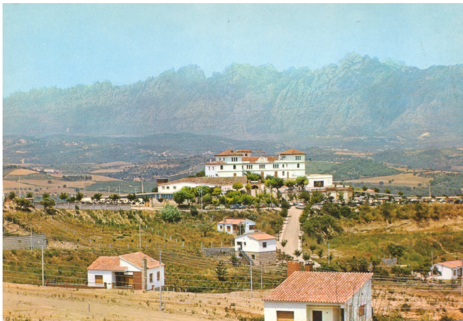
126. Vista de la masia Can Parellada, 1970.

El turisme estava en boga a Catalunya, i el poble de Masquefa es preparava per patir la més gran transformació urbanística, demogràfica i econòmica que hagués vist mai.