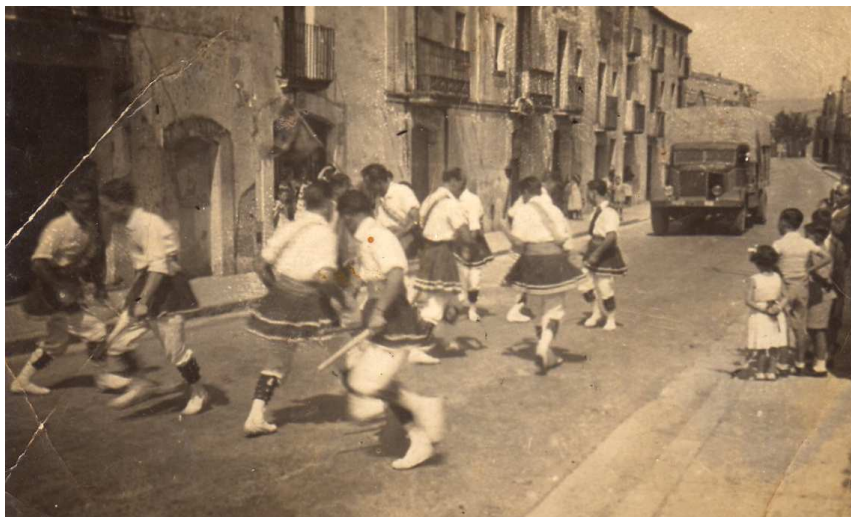
120. Masquefa, juliol del 1948. Festa Major. La Colla dels Bastoners ballant el Rotllet al carrer Serralet.

En arribar el dia, els balladors van cobrir la distància de Masquefa a Pierola a peu durant més de dues hores. Els seguïen dos carros, un que portava la roba de ballar i el dinar i un altre que duïa l'avi de cal Pintor i l'avi de ca la Sabina , junt amb les dones i mares d'alguns bastoners.