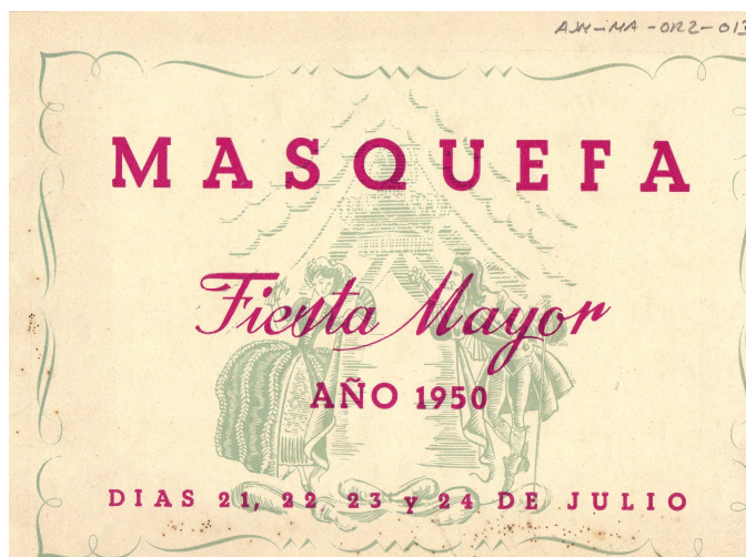
128. Festa Major, 1950. Portada del Programa.

Després de dos anys d'arribar tard al cercavila, el 1953 els Bastoners van decidir de llogar un camió petit, que els vindria a buscar a la barriada de cases de Can Marçet i que els duria per la carretera de Pierola fins a Esparreguera.