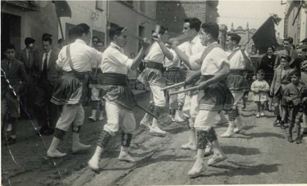
124. Sant Esteve Sesrovires, 1949. Festa Major. La Colla dels Bastoners ballant la Processó.

qual es coneixia un autocar que s'encarregava de pujar al poble els passatgers que arribaven en tren fins a l'estació del Carrilet. En això, l'Àngel explicava una anècdota que il·lustra prou bé els problemes que tenia la colla per desplaçar-se: " (...) arribats a l'estació de Capellades no hi havia cotxe per pujar a dalt del poble, car s'havia espatllat; però sí hi era una tartana amb el cavall i ja ens tens