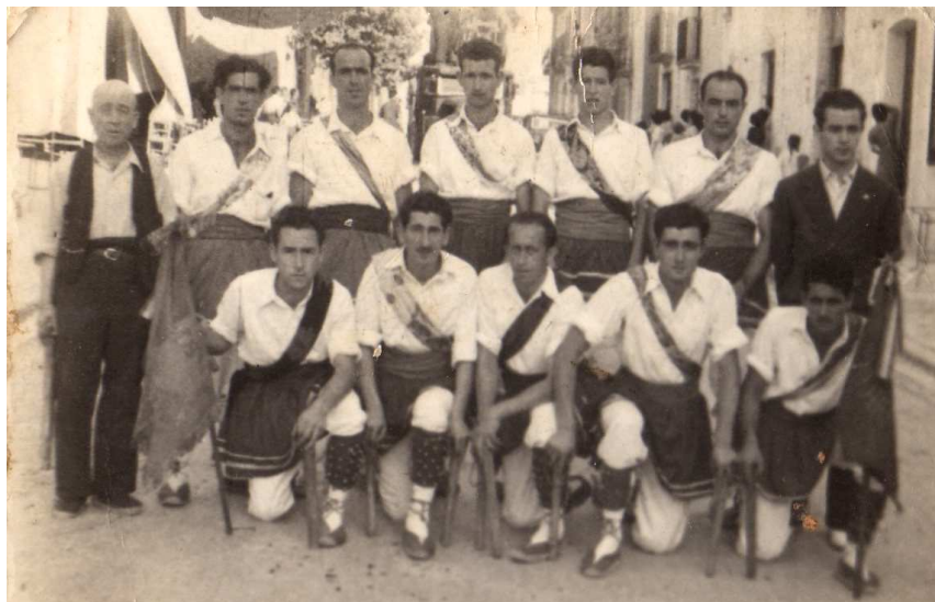
119. Masquefa, 22 de juliol 1947. Festa Major. La Colla dels Bastoners posant al carrer Crehueta.

Finalment va arribar el cap de setmana que havien de marxar cap a Barcelona i com havien de ballar els dos dies van haver de pernoctar a ciutat. La processó començava a la Catedral i la pensió Ripalda encara existia al mateix lloc del