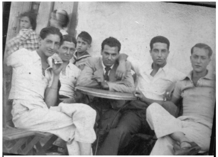
125. Masquefa, anys quaranta. Els nois macos, al Cafè.

"I tot perquè plovia", dèiem en començar aquest apartat. La cosa certa és que la reorganització de la colla obeïa al desig de voler viure un dia normal enmig d'un ambient tant gris i desesperançador per a la joventut com ho va ser aquell dels anys quaranta del segle XX. Tot i la caiguda de Hitler a Europa, el monstre del règim feixista gaudia de molt bona salut a la península. Haurien de passar vora quaranta anys perquè passés allò que esperaven el 1945. Però, en tant, els joves que havien estat espoliats de les seves il·lusions amb la guerra no deixaven de ser joves i de voler reclamar d'alguna manera el seu dret a la felicitat. Ballar