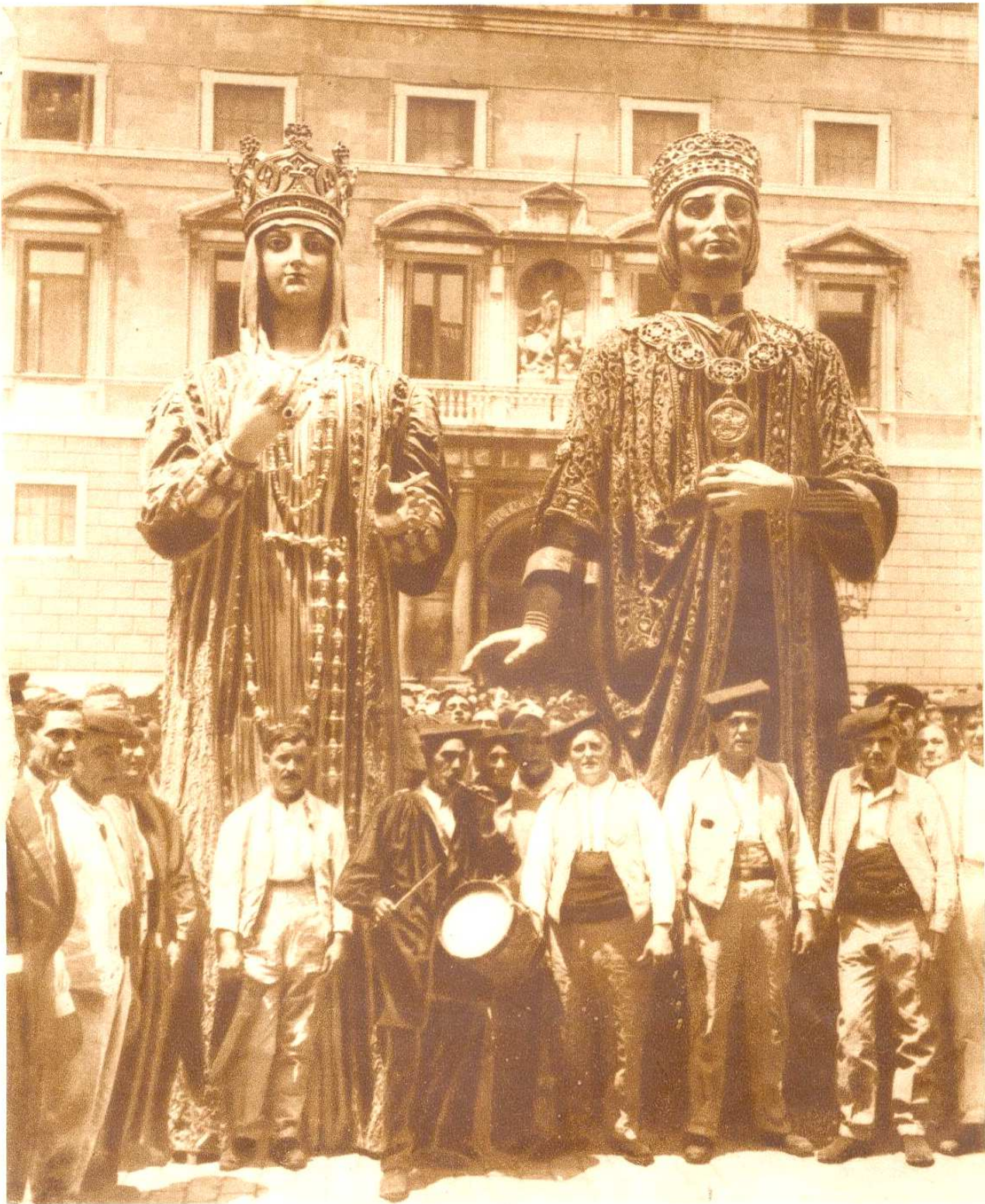
Los famosos gigantes, que con los no menos famosos cabezudos, salen á recorrer la ciudad anunciando las fiestas del Corpus, en su primera visita al Ayuntamiento

71. Corpus. Mundo Gráfico. Barcelona. 11-06-1925.