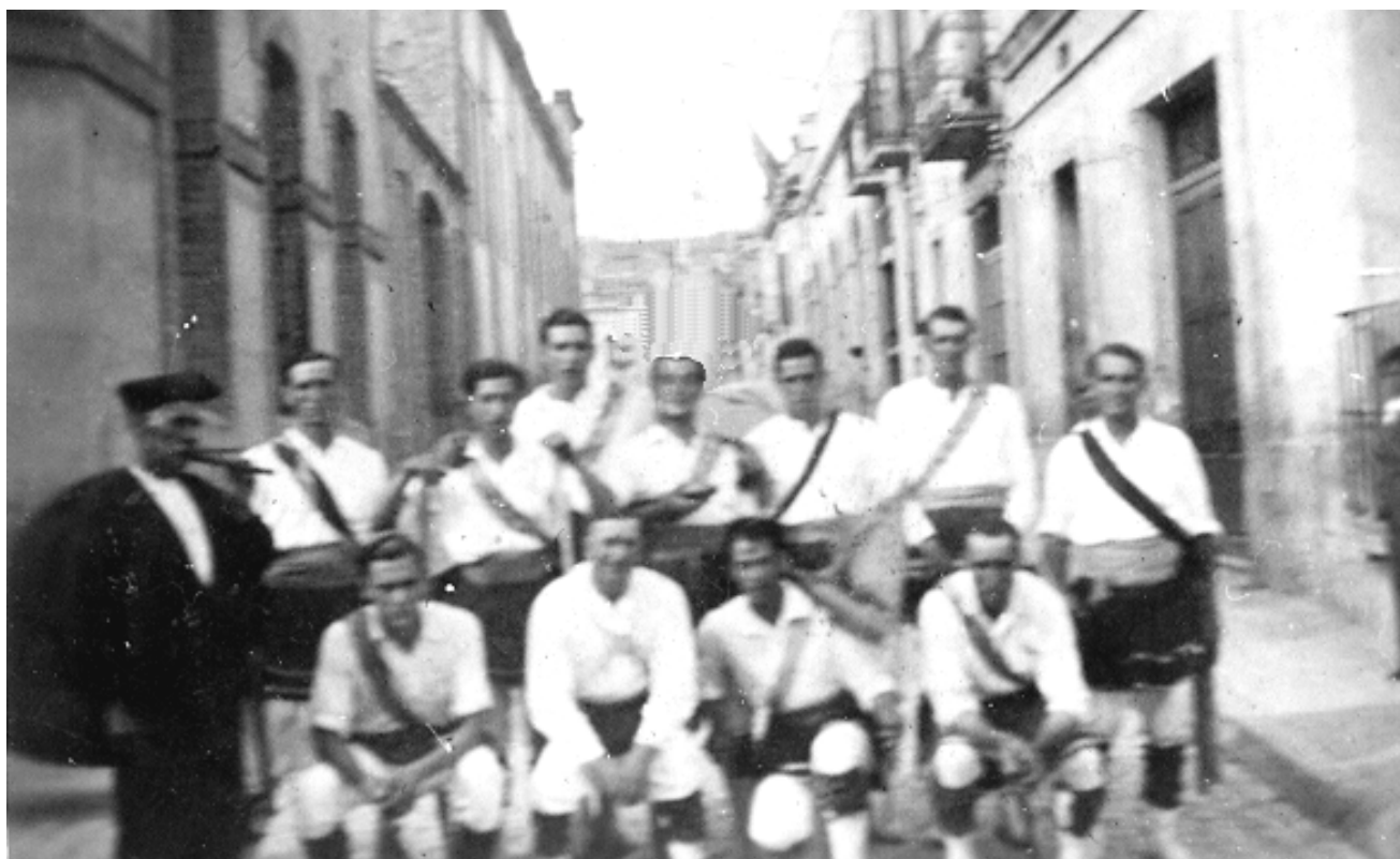
100.a. Bastoners de Masquefa. Badalona, 1927.