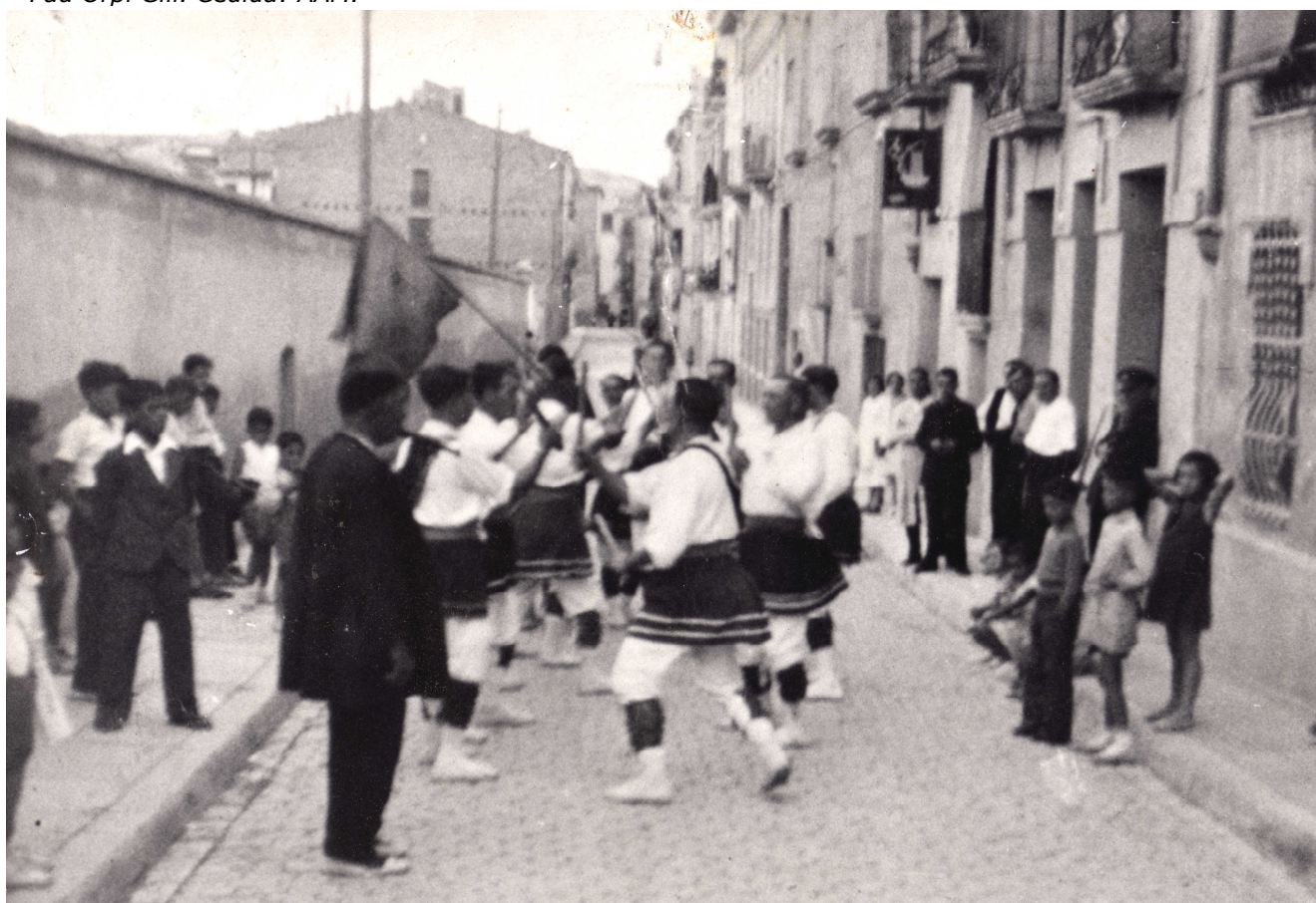
100.b. Bastoners de Masquefa. Pels carrers de Badalona, 1927.