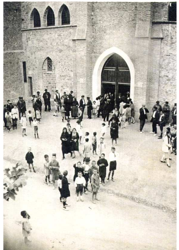
98. Sortida de la primera missa. Masquefa, 24-04-1924.

A les deu del matí va sortir la processó des de la Capella del Roser fins a l'església nova per tal de dur-ne la custòdia.