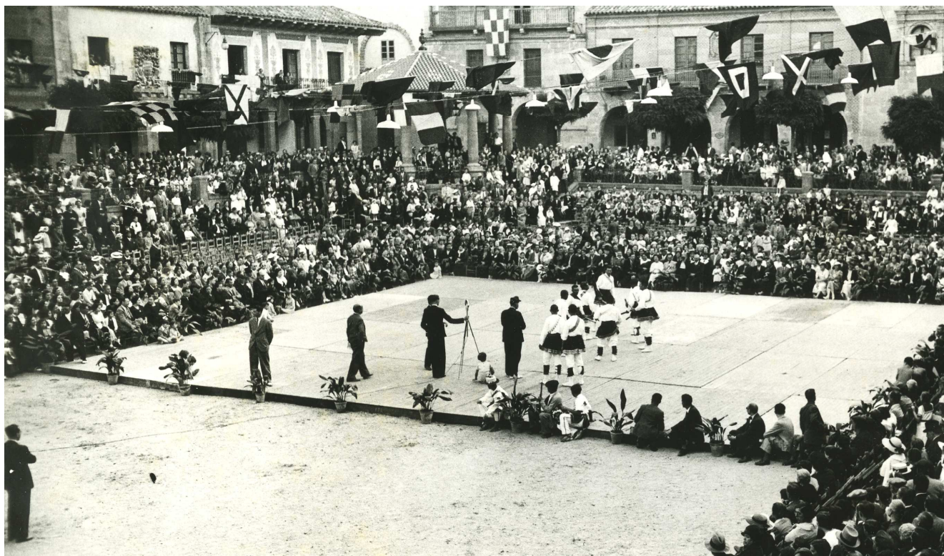
101. Barcelona, 14-09-1929. Sortida dels Bastoners de Masquefa a ballar en la Plaza Mayor del Poble Espanyol dins el marc de festeigs de La Exposició Internacional de Barcelona.

La Direcció de l'Exposició i la Casa del Penedès a Barcelona havien convingut en presentar dins els diferents actes que s'hi durien a terme l'any 1929 una mostra significativa de les festes majors de l'àrea del Penedès per tal de donar un toc de color i pólvora al recinte iber. Hom també va proposar d'organitzar competicions entre els diferents grups que hi assistissin: Gegants i Nans, Castellers, Diables i Bèsties, Ball de Cercolets i Gitanes, Ball de Bastons, etc. per tal de motivar-ne la seva vinguda a Barcelona.