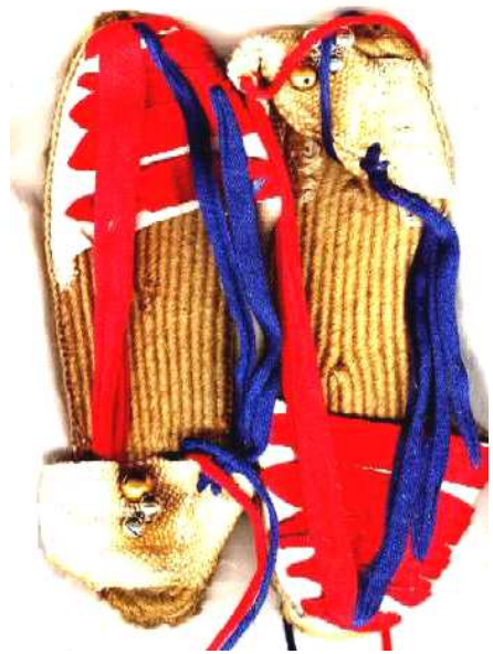
5. Model actual d'espardenya.

El 1984 els bastoners van canviar les espardenyes blanques per unes de les betes blaves i vermelles. Les betes blaves van en el cantó de fora dels peus.